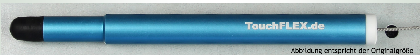
Abbildung entspricht der Originalgröße

TouchFLEX® U140AS - Die universelle Lösung für kapazitive + resistive Display-Technik Die Serie U140 AS zeichnet sich durch eine stabile und robuste Ausführung von Stift und Halter aus. Die weiche und robuste Stiftspitze schont das Touchdisplay. Auch für die Verwendung mit Handschuhen gut geeignet.